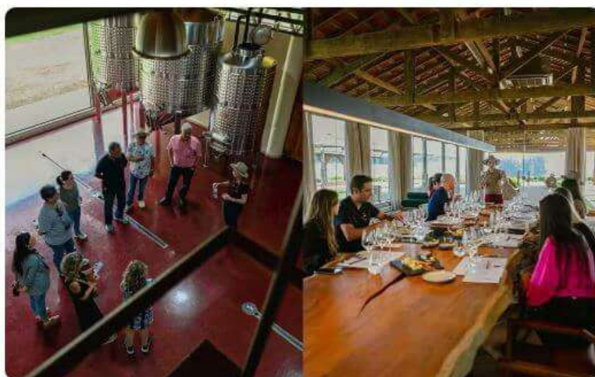
Enoturismo São Gonçalo do Sapucaí

2.º etapa: A segunda etapa é constituída pela produção, onde os visitantes conhecem a área de produção e expedição da vinícola. Durante o percurso aprendem sobre as etapas de produção dos vinhos finos, desde o recebimento das uvas até o processo de envasamento e rotulagem, bem como os diferentes maquinários utilizados.